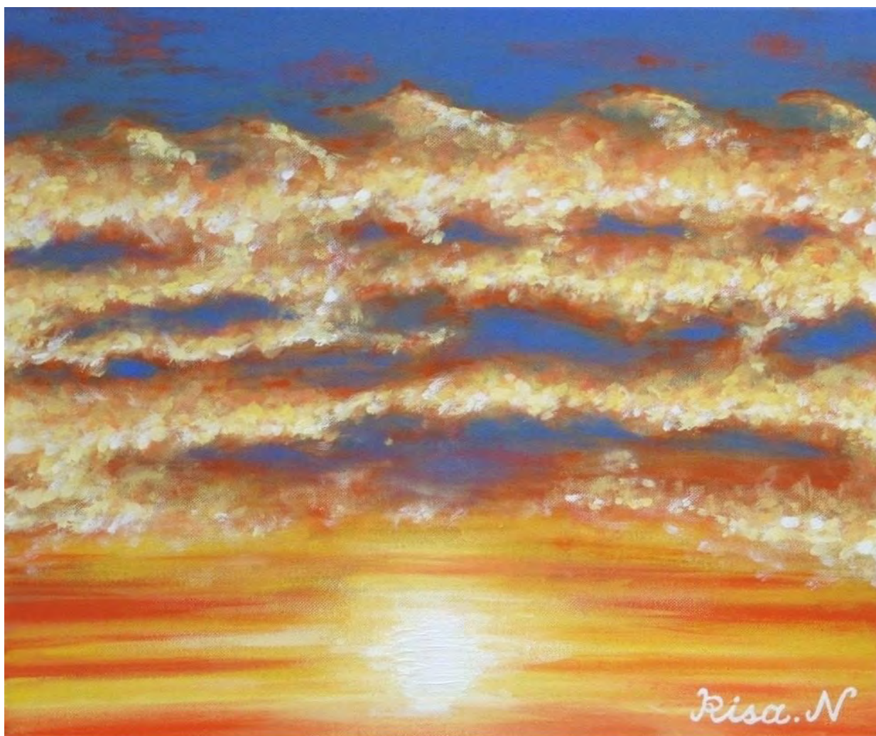
【この夕日を覚えてる?】作：中澤理沙